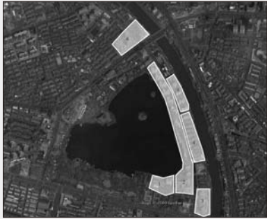
图1 莫愁湖一带现状平面图