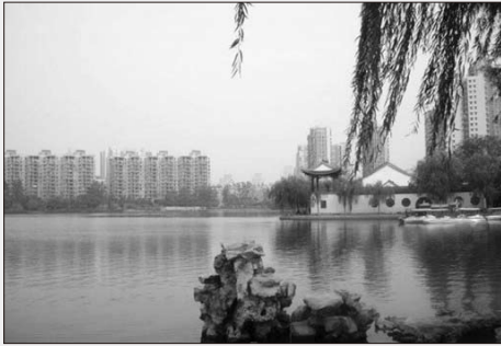
图2 环莫愁湖现状环境图