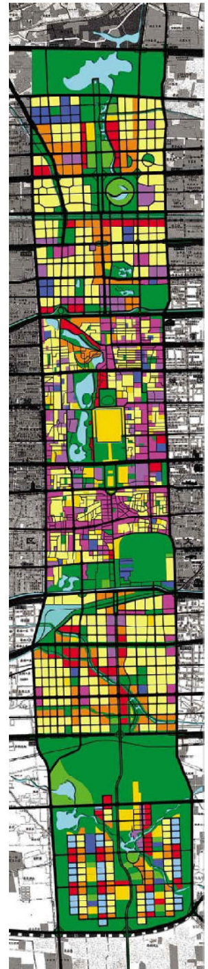
图4 北京中轴线规划设计