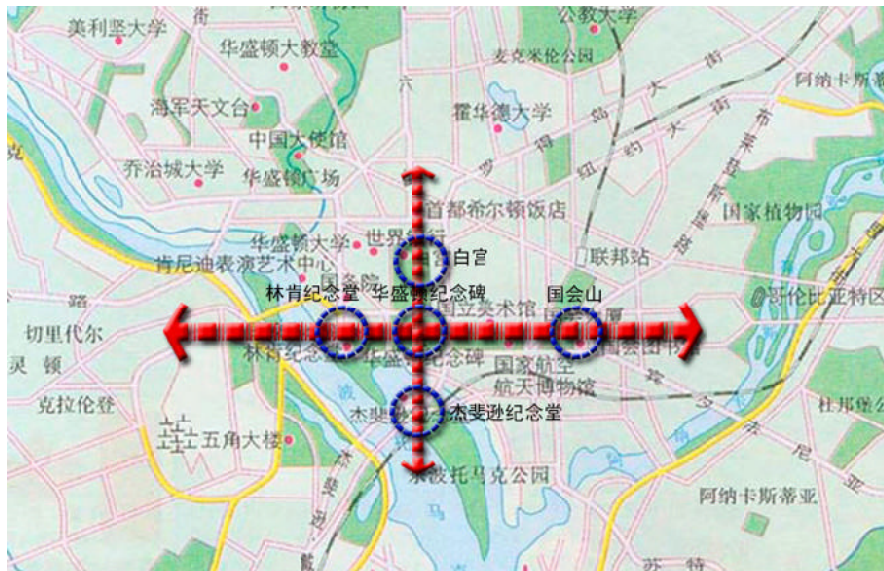
图1 华盛顿城市轴线示意图

中央为林荫带。轴线从华盛顿纪念碑延伸，主要借林肯和杰斐逊纪念堂分别作对景来强化轴线。