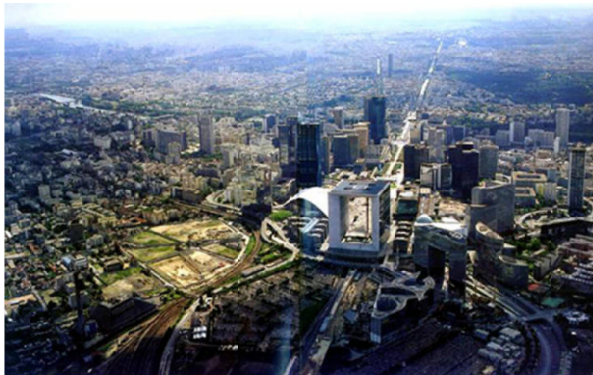
图7 巴黎新城区鸟瞰