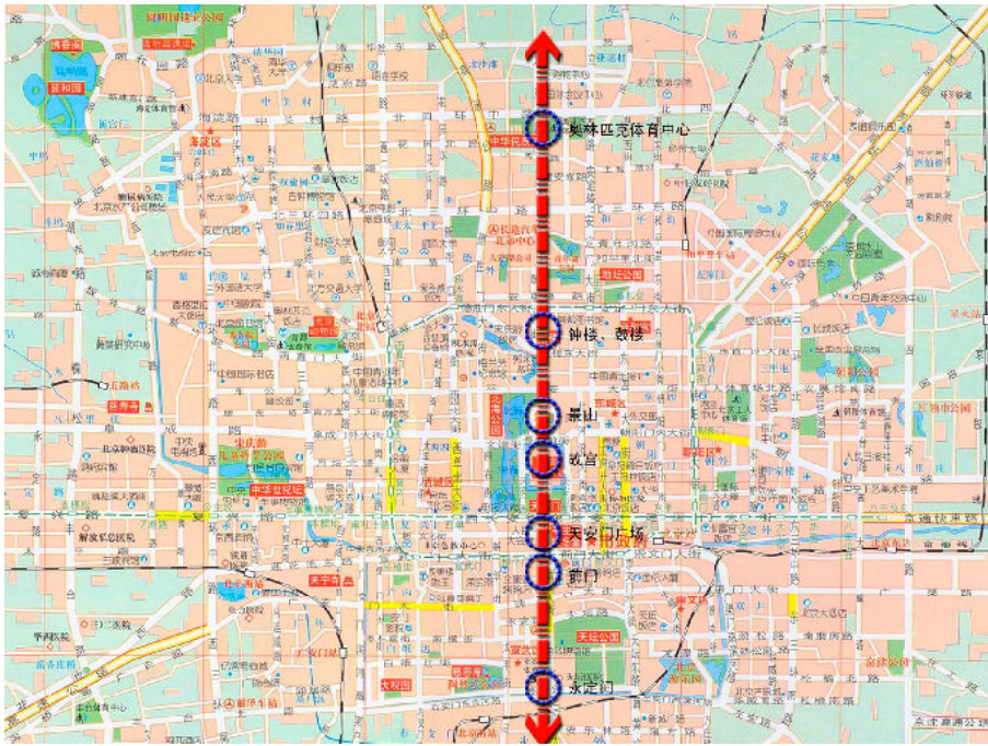
图2 北京市城市轴线示意图