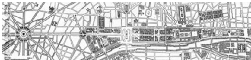
图6 巴黎城市主轴线