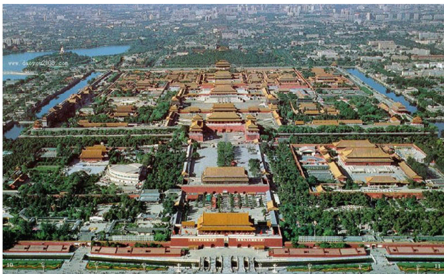
图3 北京市传统轴线景观