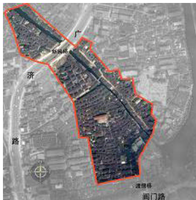
图2 山塘街研究范围示意图