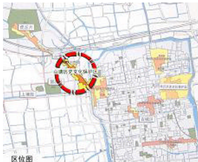
图1 山塘历史街区区位图

历史街区的空间更新源自于其社会结构和网络的变化,最直观的反映就是外来空间主体的侵入。山塘历史街区位于苏州古城边缘,其文化和经济价值早已为政府及社会各界所认知,加之政府推动下的空间更新的实施,使得多种多样的主体也开始进入街区内部,并改变了街区旧有的社会空间结构,进而新的空间主体在对空间进行消费的同时也开始影响着空间的生产。对于山塘历史街区而言,其外来空间主体主要有两类,一类是以经营、打工等为目的的外来居住者,他们成为这一地区新的空间占有者,而另一类主体则是由街区的商业性更新而吸引的消费旅游群体,他