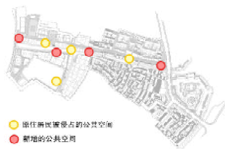
图4 山塘历史街区更新前后的公共空间布局演变示意图