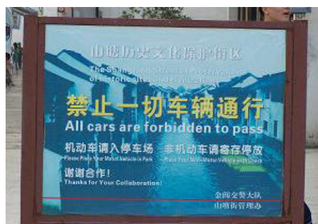
图5 禁止通行的标志牌

人员迁入了山塘街区。外来务工人员以及游客购物者的大量涌入,一方面使得山塘街区的人口素质下降,原住民在生活方式被迫做出适应性调整的同时,也丧失了街区生活环境的归属感,甚至产生了外迁的需求;另一方面,由于语言、文化背景上的差异,两类空间主体之间的交往受到限制,致使社区的邻里关系和邻里交往网络遭到阻隔甚至切断,因而街区原有的文化关系和习俗被迅速消解。